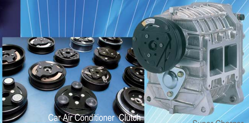
Car Air Conditioner Clutch