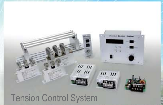
Tension Control System