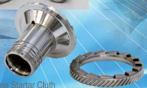
Engine Starter Clutch