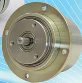
Electromagnetic Particle Brake