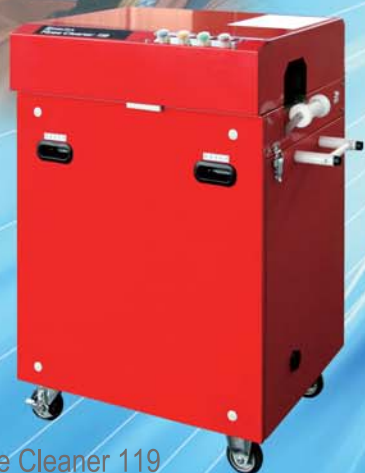
Hose Cleaner 119